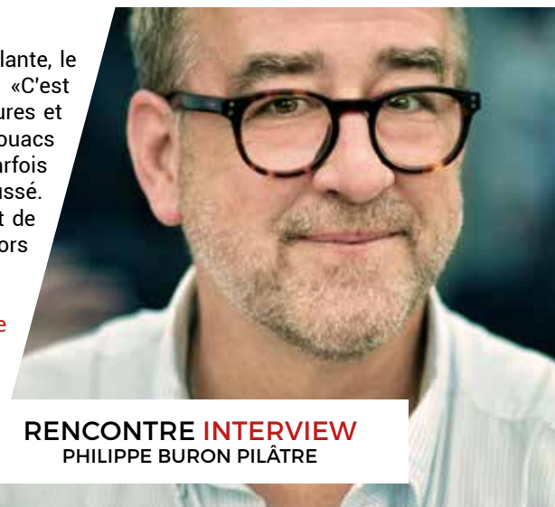
RENCONTRE INTERVIEW PHILIPPE BURON PILÂTRE

The Regional Council of Lorraine will be the Saturday party hero. The development of this former base was masterfully conducted to provide to air sports disciplines, a real air stadium which made many envious in Europe. During LMAB, the Region offers including entry and parking for visitors, making it a notable exception allowing Lorraine inhabitants (70%), French (20%) and foreigners (10%) to take advantage of an exceptional show. Each day contests, taking place on the Ballonville Public podium, allow to win three first flights in a balloon. A day which will allow one to meet JF Clervoy and Gérard Feldzer, regulars of the event. The savanturier Bertrand Piccard, arrived since Thursday, just went back from his interrupted trip aboard the Solar Impulse. And everyone hopes that this Saturday will be magical, in the colors of a main partner which supports an event where amazed visitors, enthusiasts pilots smiling volunteers are able to meet.